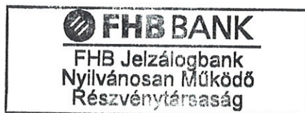
FHB Jelzálogbank Nyrt. Kibocsátó